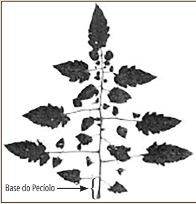
Figura 1B: Base do pecíolo utilizada para determinação de nutrientes na seiva

As concentrações de \text{NO}_3^- , \text{K}^+ e \text{Na}^+ na solução do solo determinadas pelos medidores de íons Cardy e pelos métodos padrão em laboratório foram encontradas fortemente correlacionadas (Figura 2). As concentrações de \text{NO}_3^- medidas pelos medidores de íons Cardy foram cerca de 39% menores do que aquelas determinadas pelo método de destilação, enquanto as concentrações de \text{K}^+ e \text{Na}^+ foram 21% e 67% maiores, respectivamente, do que aquelas determinadas por fotometria de chama. Os coeficientes de determinação ( r^2 ) foram altos para todos os íons e as relações foram significativas ao nível de 1% (Tabela 1).