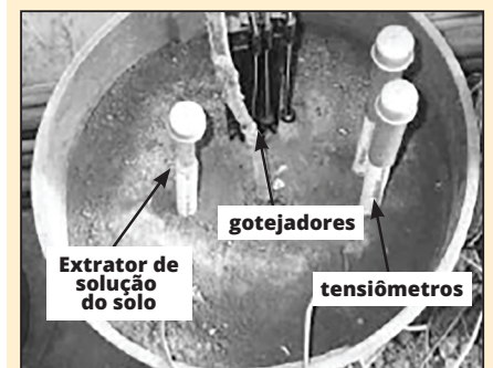
Figura 1A. Experimento em vaso

Os medidores portáteis de íons Cardy foram calibrados com duas soluções padrão antes do uso e após cada 10 amostras. Para evitar contaminação por carry-over, os sensores foram lavados com água destilada entre amostras.